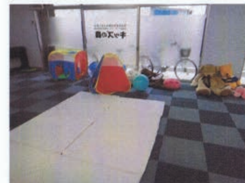
約120㎡の広いプレイルーム。 マットの上で寝転ぶ児童もいた。 室内でボール遊びもできる。