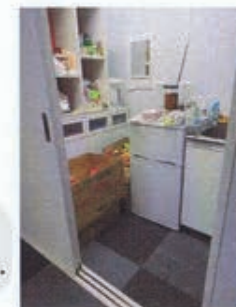
おやつ類をしまっている部屋。 児童の手の届かないようにしているが...