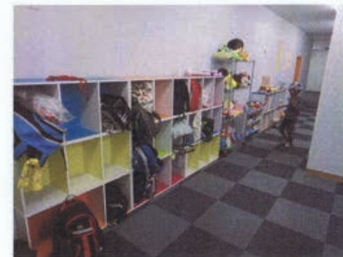
荷物をしまうロッカー (固定されている)