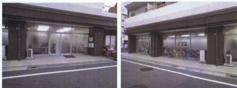
事務所側の入り口